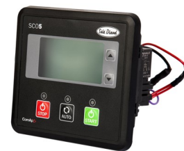
Tableau SCO 5