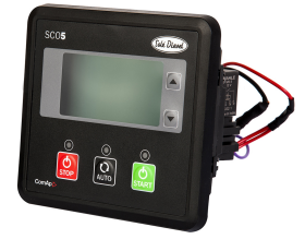
Tableau SCO 5